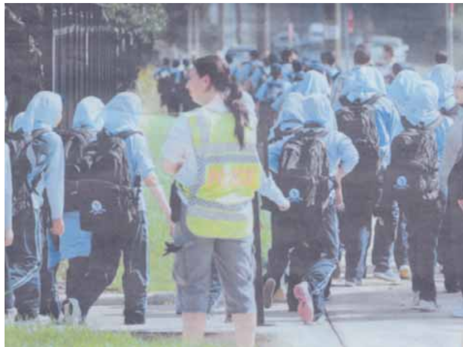
Μαθήτριες του μουσουλμανικού κολεγίου εγκαταλείπουν το σχολείο τους μετά την έκρηξη.

Από την έκρηξη στο ιδιωτικό μουσουλμανικό κολέγιο τραυματίστηκε βαριά ένας άνδρας 50 χρονών, ενώ τοποθετούσε μια πινακίδα σε αποθήκη δίπλα στην καντίνα.